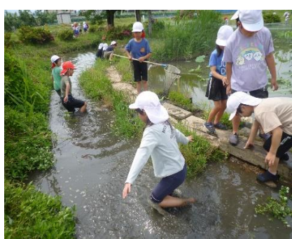
2年「生活科いずみの里(6/8)」 日野の自然の中で学ぶ