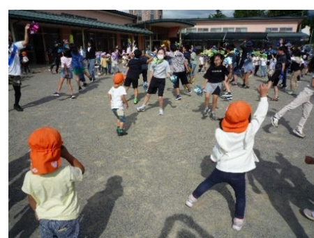
4年「日野保育園でダンス(6/9)」 みんなでいっしょにダンス