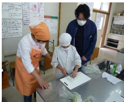
3年親子「クッキング(6/14)」 栄養士会、須坂市健康づくり課の皆様