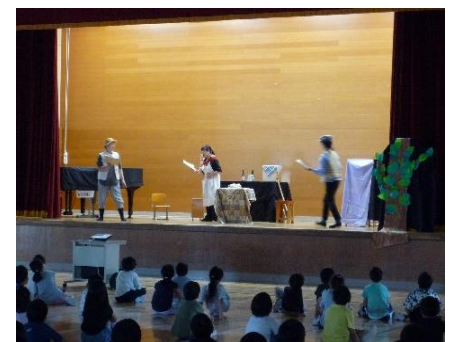
全校「お話の会(6/20)」 たんぽぼの皆様