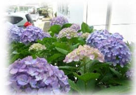
日野小会議室前のあじさい

1学期を振り返ると、子どもたちは様々な行事から体験的に学び、地域の皆様、外部講師の先生方等のご協力を得ながら、一人一人成長をすることができたと感じています。ありがとうございました。その成果や成長を振り返り、2学期につなげてほしいと思います。