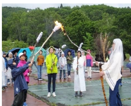
5年「峰の原自然体験(6/27,28)」 火の神 出現! キャンプファイヤー